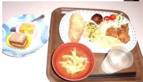
みごとな大盛り！ 育ち盛りの生徒たち・・・？